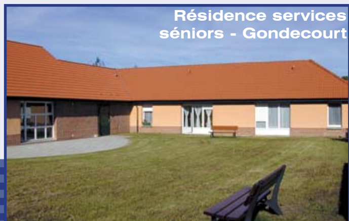
Résidence services seniors - Gondécourt

En cas de panne de plomberie et du chauffage individuel, vous pouvez contacter directement l'entreprise chargée des dépannages.