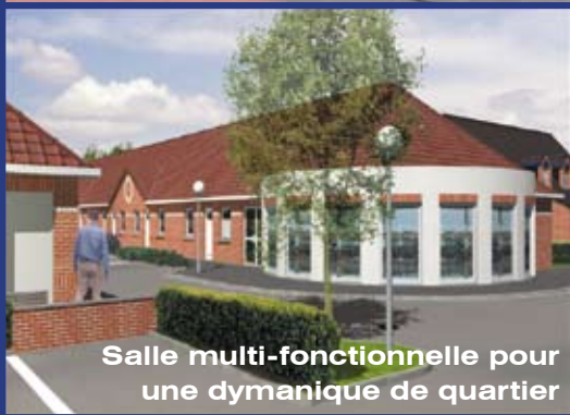
Salle multi-fonctionnelle pour une dynamique de quartier