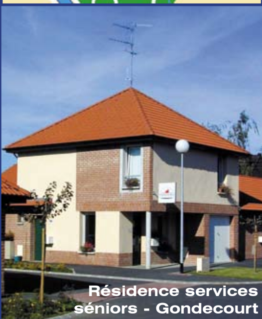
Résidence services seniors - Gondécourt